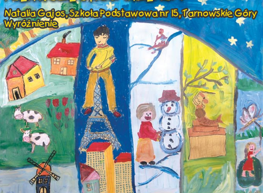
Co to jest UE?

Unia Europejska to wspólnota 27 państw, które podzielają te same wartości, zasady i cele. Najważniejsze z nich to: bezpieczeństwo, idea postępu gospodarczego i społecznego oraz ochrona wolności, praw i interesów obywateli. Wśród polityków, którzy stworzyli śmiały plan budowania zjednoczonej Europy byli m.in.: Robert Schuman i Jean Monnet z Francji, Konrad Adenauer z Niemiec, Henri Spaak z Belgii, Alcide de Gasperi z Włoch. To właśnie ich określa się mianem „Ojców Zjednoczonej Europy”.